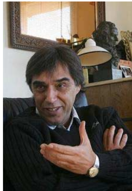
El director Agustín Díaz Yanes.