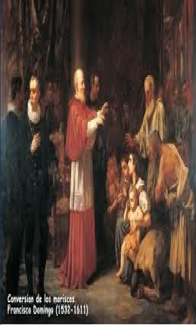
Conversión de los moriscos. Francisco Domingo (1832-1811)

• Durante la mayor parte de la Edad Media, judíos y cristianos habían convivido en paz y armonía, en contraste con el resto de Europa. En esa época, si había un lugar donde los judíos pudieran sentirse seguros, era en España. Inglaterra y Francia habían expulsado a los judíos en los siglos XIII y XIV respectivamente por presión de las clases más elevadas de la sociedad, que temía la competencia económica de los hebreos.